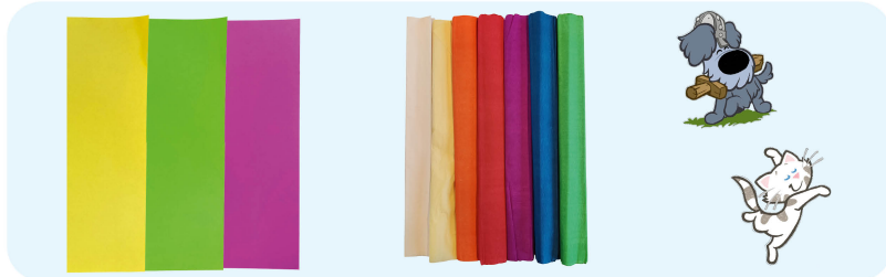
Dik gekleurd papier