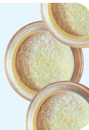
Glitters + andere versiersels